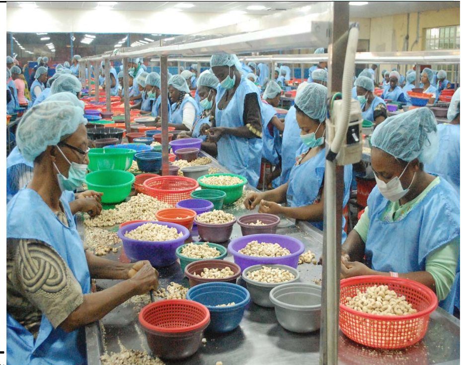
Valency factory – Ogun State, Nigeria